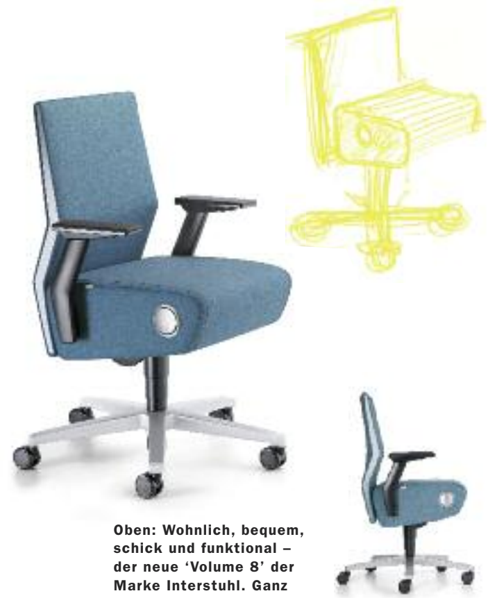
Oben: Wohnlich, bequem, schick und funktional – der neue 'Volume 8' der Marke Interstuhl. Ganz nach Wunsch mit T- oder verstellbaren Ringarmlehnen. Darüber hinaus bietet der Office-Profi für die neue Sitzgeneration zwei Bürodrehstuhl-Varianten mit unterschiedlichen Lehnhöhen sowie zwei verschiedene Konferenzsessel an.