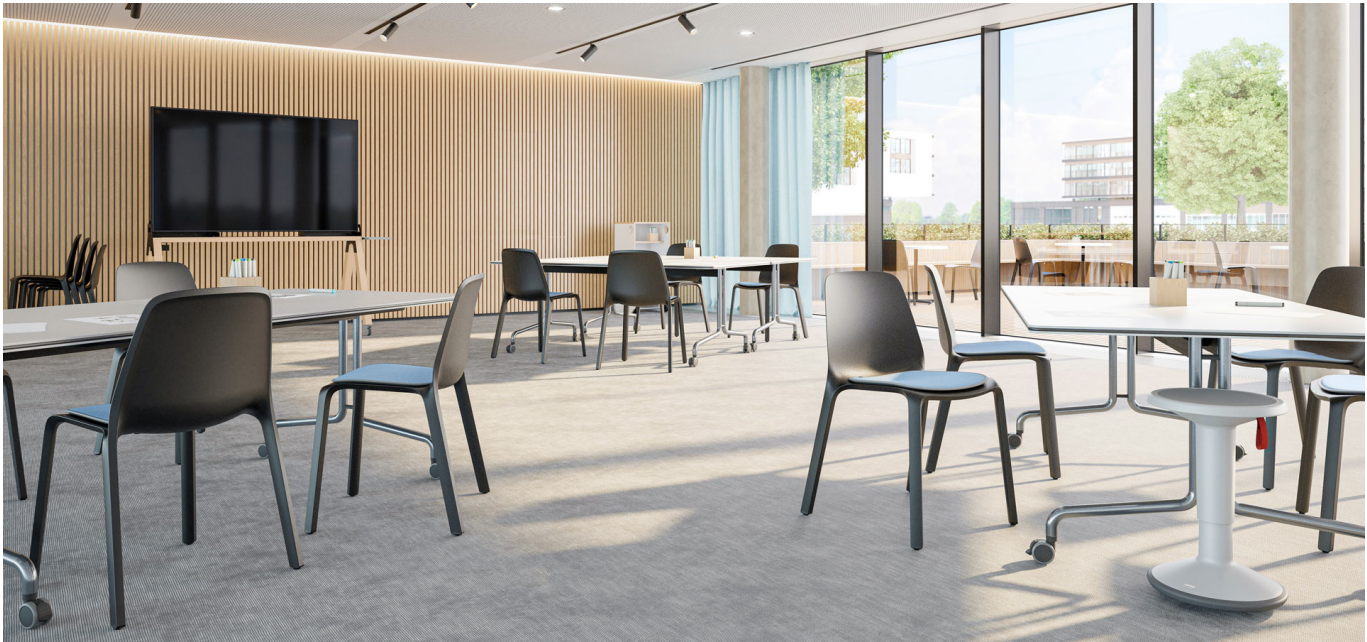
MONO- Ausgezeichnet mit German Design Award

MONO wurde auf der ORGATEC 2022 in Köln erstmalig präsentiert und inzwischen vom RAT für Formgebung mit dem German Design Award, Kategorie Winner, ausgezeichnet.